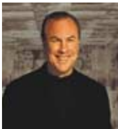
Portrait of Robert Wilson

他從各種舞臺藝術到藝術作品的多層次藝術方面，博得了世界上廣大觀眾和評論家的高度評價，在世界文化藝術的殿堂裏佔有主導地位。