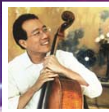
馬友友 Yo-Yo Ma

熱愛地球的世界級音樂表演家們，通過“音樂”這個世界共通語言，傳遞了“Love The Earth”的理想。當然這其中也有來自日本的藝人們。那是，代表我國的藝人又是誰呢？敬請期待。