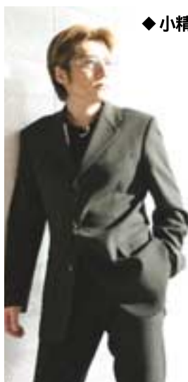
石井竜也 Tatum Ishii

1985年組成“米米俱樂部”樂團而開始嶄露頭角。俱樂部解散之後，他從獨唱活動開始，繼而在音樂和電影導演等多方面也都發揮了特殊的才能。