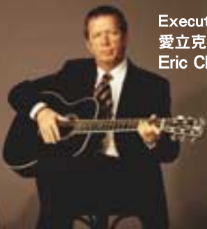
Executive Music Consultant 愛立克·柯拉普頓 Eric Clapton

這位“吉神之神”寫下了“Say What You Will”，作象徵性樂曲提供給了我們。雖然沒有實演預定，但是，將會收錄在[Love The Earth專集CD]當中。請您給與期待。