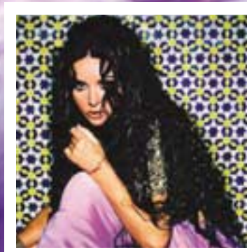
瑟拉為布拉依瑪 Sarah Brightman