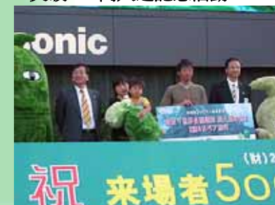
突破500萬人之記念活動

5/21 愛知地球會議主題論壇5月 「邁向環境本位主義社會－21世紀科學之應有面貌」