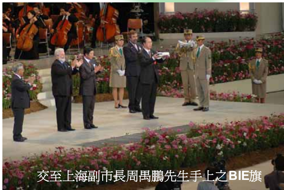
交至上海副市長周禹鵬先生手上之BIE旗