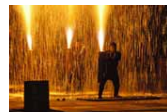
火焰煙火愛知縣週（13日）