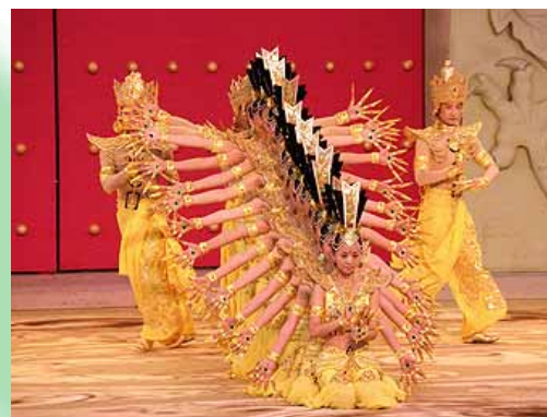
視聽障礙者表演的舞蹈·千手觀音

5/19 中華人民共和國日 吳儀副總理出席典禮。京劇、雜技以及華麗的表演感動了入場者