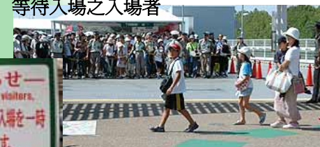
約下午一點左右，在西門 等待入場之入場者

9/16入場人數突破 2000 萬人 開幕以來第 176 天。自8月18日開幕以來， 以不到一個月的速度達成 1500 萬人的目標。