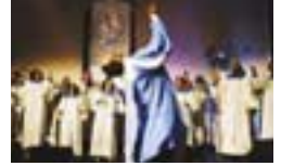
출연예정 그룹 중에서 The Born Again Church

불교 음악과 기독교 음악, 이슬람교 음악 등 기도를 위한 음악이 한곳에 자리합니다. 세계의 '기도 음악'이 관객을 감동의 도가니로 인도합니다.