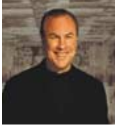
Portrait of Robert Wilson

각종 무대예술과 아트작품에 이르기까지 다양한 예술분야에서 전세계의 관객과 평론가로부터 높은 평가를 받고 있는 세계예술문화계의 리더.