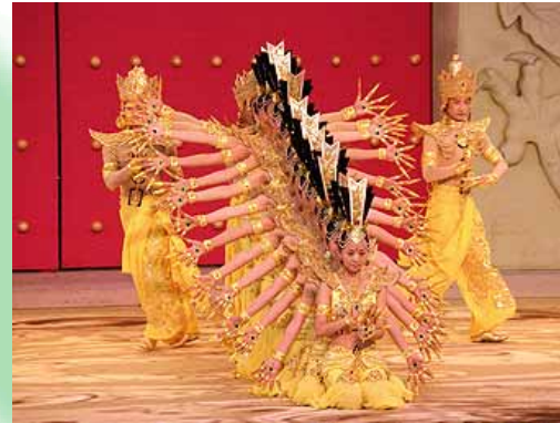
청각장애인 팀의 무용·천수관음