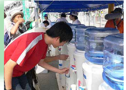
무료 급수 서비스

6/17 단체버스 입장 1,107대 (기간 중 최고) 누계 입장 버스 수 11만 3천 285대