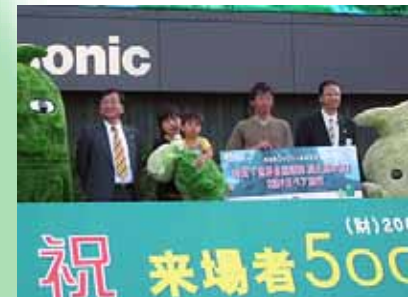
500만명 돌파 기념 행사

5/21 아이치 지구 회의 테마 포럼 5월 「환경본위형 사회를 목표로 ~ 21세기 과학의 나아갈 길」