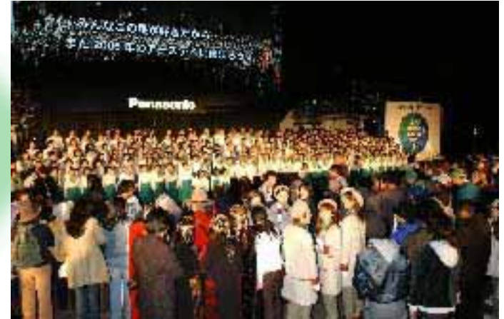
Earth day EXPO