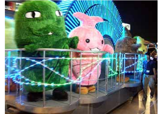
입장객에게 인사하는 모리조외 기코로

8/22 「엑스포 올 스타즈 퍼레이드 2」 재개 7월 29일에 시작된 야간 이벤트는 경비문제 등으로 2일부터 중지 쇼는 8일에 재개하였지만, 퍼레이드는 개최하지 않았다.