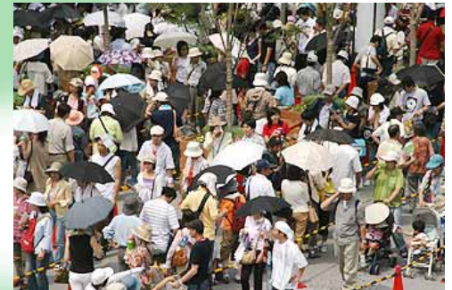
회장 내 양산을 쓴 모습(6/25)