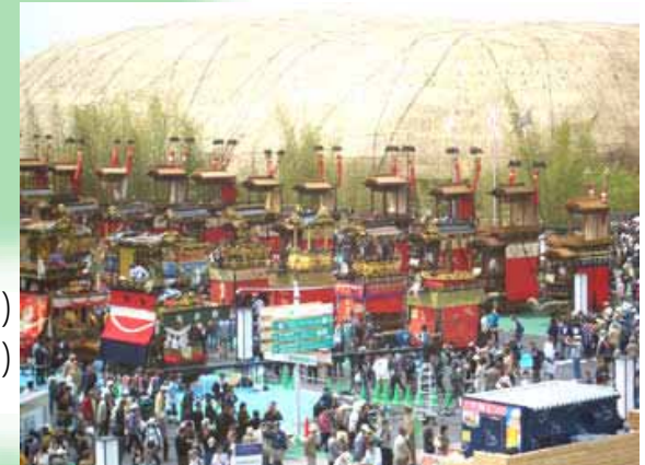
옛 수레 행렬

4/23 아이치현 Week, part 1 시작 아이치의 옛 수레 100대가 행렬