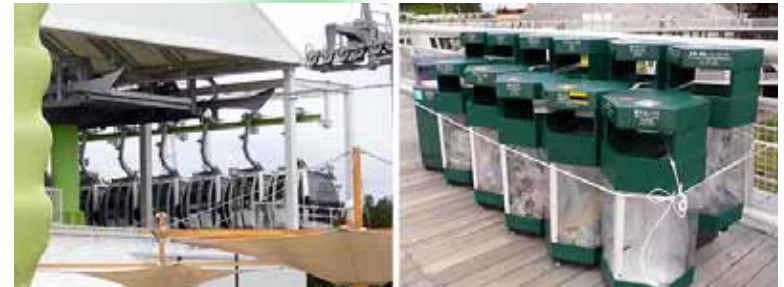
[왼쪽 사진] 운행 정지된 기코로 곤돌라 [오른쪽 사진] 바람에 날아가지 않도록 끈으로 묶은 쓰레기통

8/25 태풍 11호 접근에 대비한 예방책 저녁부터 내린 비로 중지된 이벤트도.