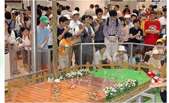
로봇을 보고 있는 입장객들

6/11 「세계 진주혼식 in EXPO」 26쌍의 부부가 결혼 30주년을 축하