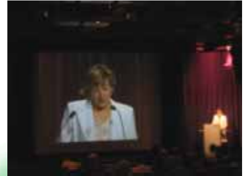
제 137회 BIE 총회(파리)