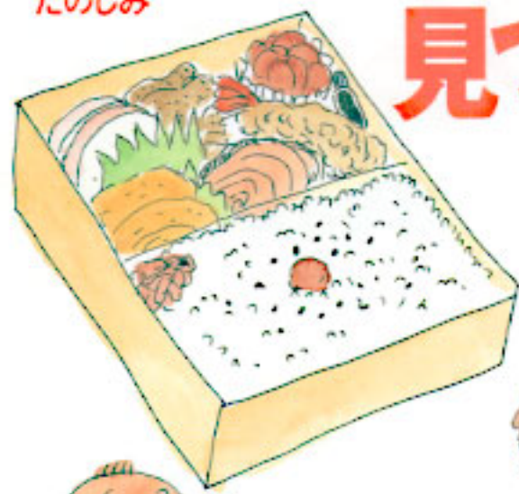
幕の内弁当のたのしみ