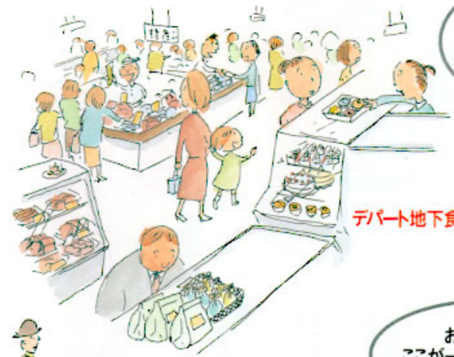
デパート地下食品売場を探検