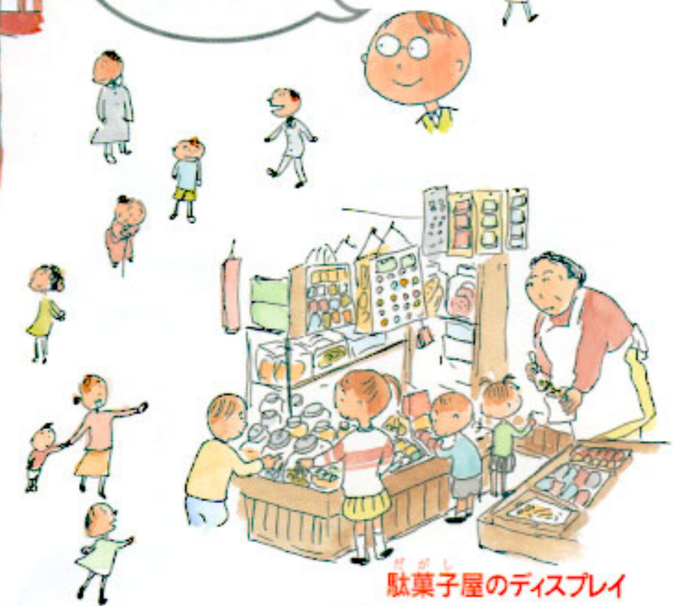
駄菓子屋のディスプレイ

いろんなものがならんだり、つまみこまれているたのしさを街に出かけて発見。縁日やデパートの地下食品売場など、ワクワクするところがいっぱいあるね。