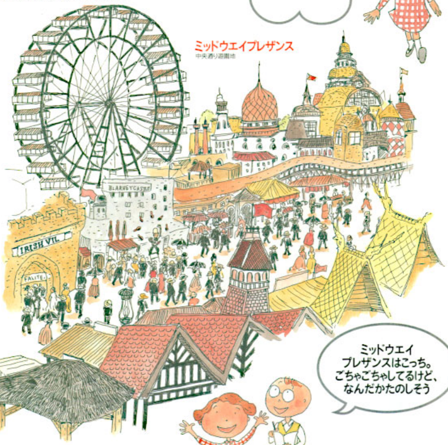
ミッドウェイプレザンス 中央遊園地