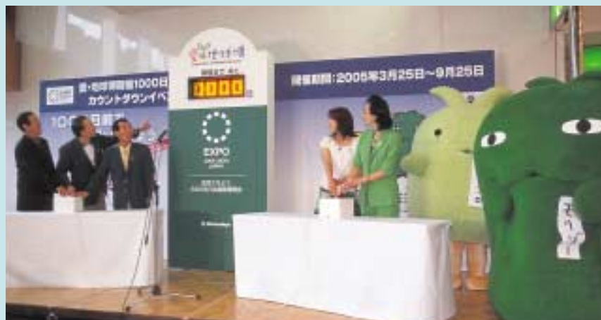
1000日前カウントダウンボードが点灯されました。