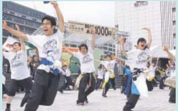
にっぽんど真ん中祭りのメンバーによる若さあふれるパフォーマンス。