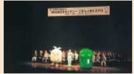
6月30日には、愛・地球博999日前を記念したセレモニーが開かれ、モリゾーとキッコロも参加しました。