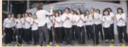
ゴスペルグループの力強い歌声が、会場一体に響きわたりました。