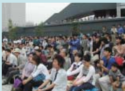
約2,000人の人たちが集まり、にぎやかなイベントになりました。