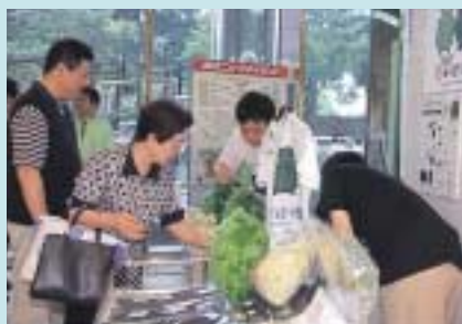
特設会場でのグッズ販売も大盛況でした。