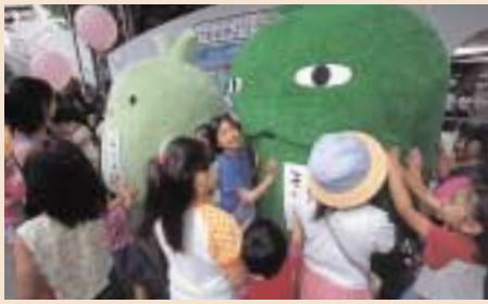
モリゾーとキッコロは子供たちに大人気でした。