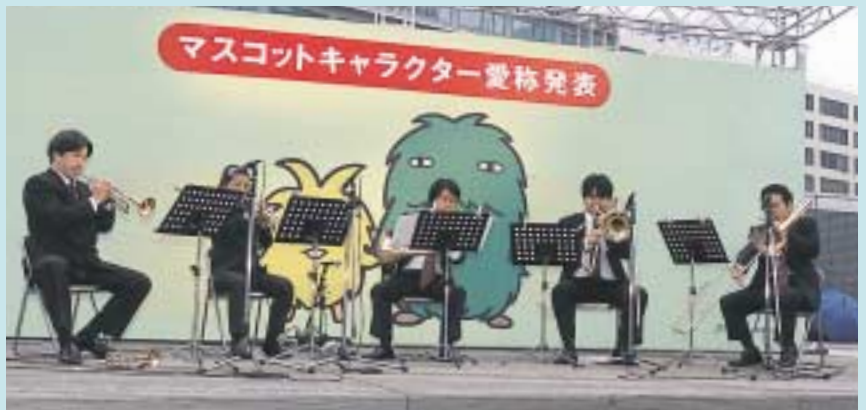
名古屋フィルハーモニーによる演奏が、会場を盛り上げました。