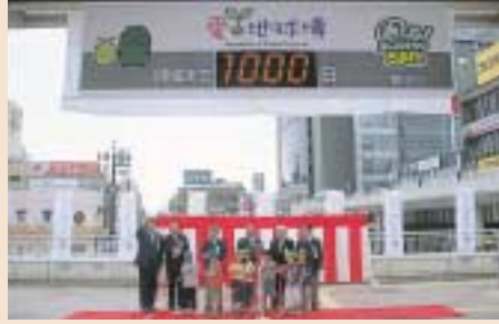
豊田市駅東口では、カウントダウンボードの除幕式が行われました。