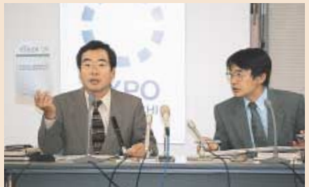
6月24日、環境影響評価書の概要を説明する 棕会場整備本部長と国安環境グループ長

博覧会協会名古屋事務所 名古屋市中村区名駅三丁目15-1 名古屋ダイヤビルディング2号館4階 博覧会協会東京事務所 東京都千代田区内幸町2-1-1 飯野ビル7階 瀬戸市役所 愛知県瀬戸市追分町64番地の1 長久手町役場 愛知県愛知郡長久手町大字岩作字城の内60-1 豊田市役所 愛知県豊田市西町3-60