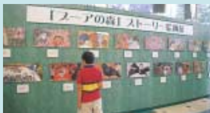
作画 / 忌野清志郎さん、文 / せがわきりさんの共著による絵本「ブーアの森」の絵画展が開かれました。