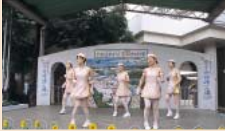
おいでんモデル連によるダンスショー。