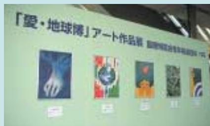
自然の叡智をテーマにした優秀アート作品を展示しました。