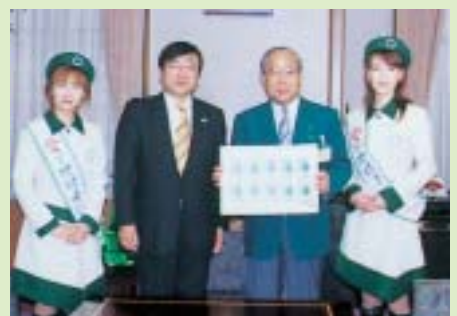
ご購入者 松原武久名古屋市長