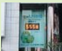
新宿アルタビル （東京都新宿区）

開幕555日前となる9月17日を「愛・地球博へ555 (GO! GO! GO!)」と銘打ち、東京、大阪、名古屋に新たにカウントダウンボードを設置しました