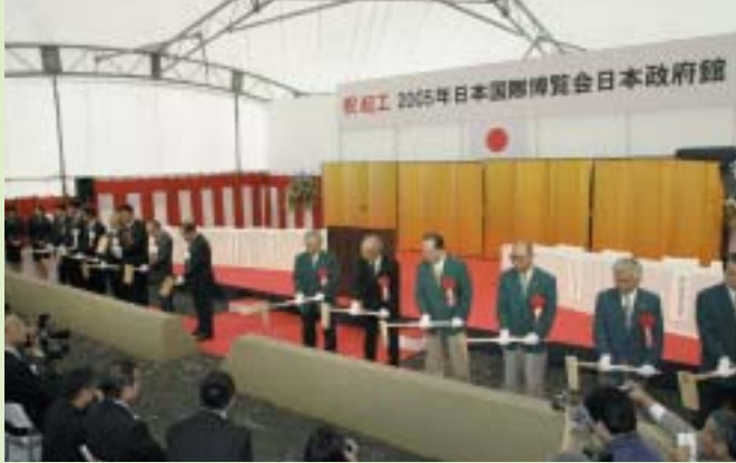
日本政府館起工式(10/16)