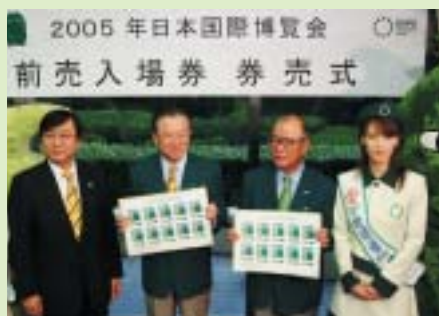
ご購入者 神田真秋愛知県知事、小林秀央愛知県議会議長