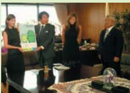
ご購入者 中川昭一経済産業大臣