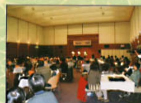
なんでも「分解」探偵団 (平成11年12月11日)