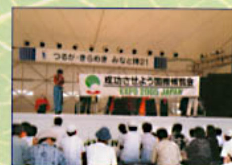
つるが・みなと博21 (平成11年7月18日)