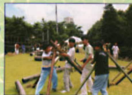
キッズ・プレイキャンパス (平成11年8月5～8日)