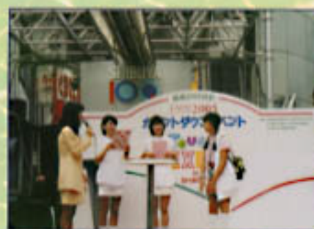
カウントダウン イベント (平成11年10月3日)