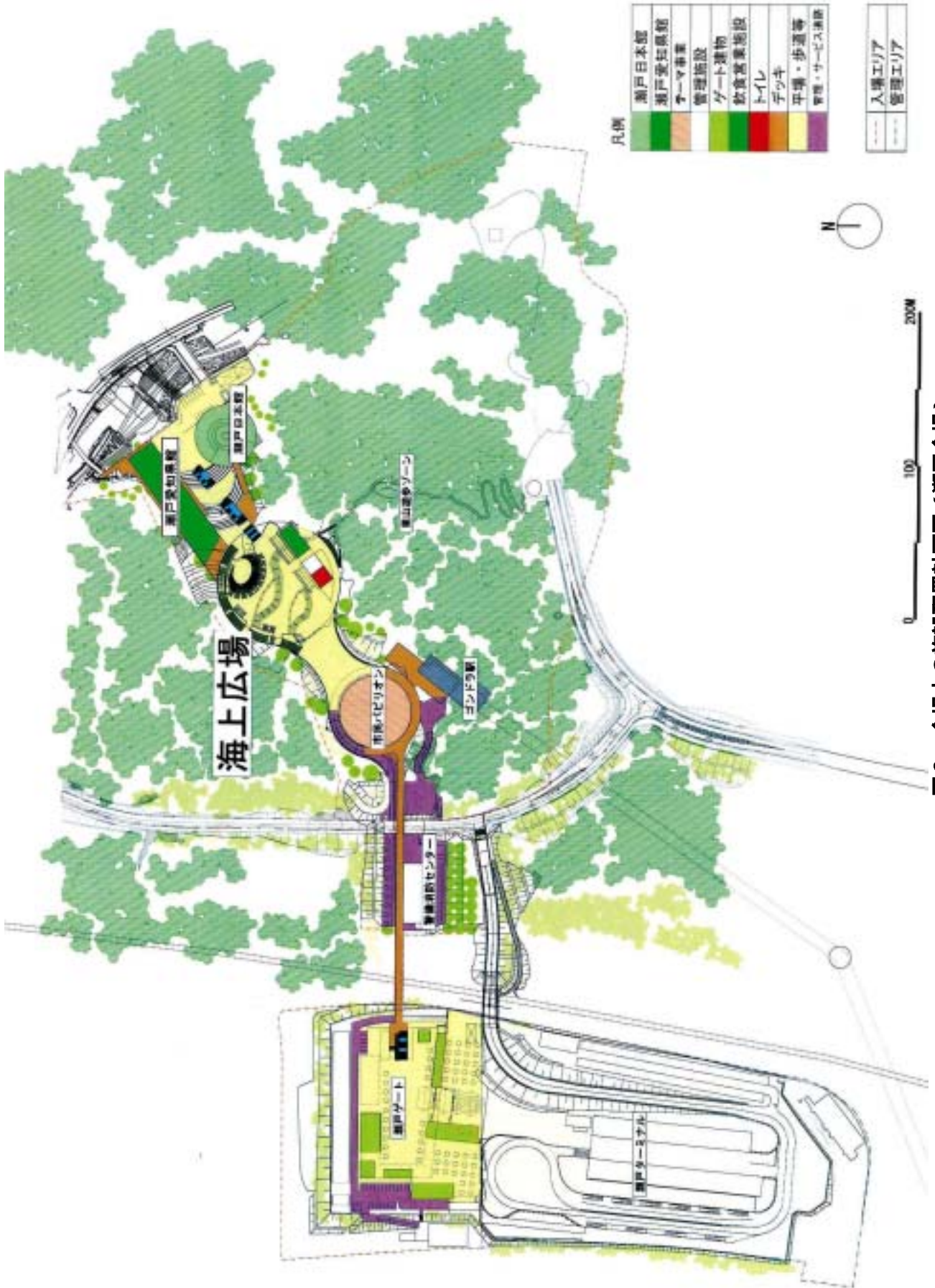
図2 会場内の施設配置計画図(瀬戸会場)