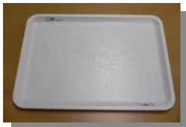
(会場に導入した配膳トレイ)