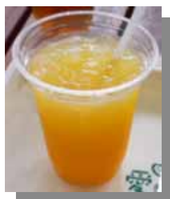
(クリアカップ使用例)