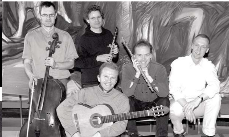
The Caput Ensemble