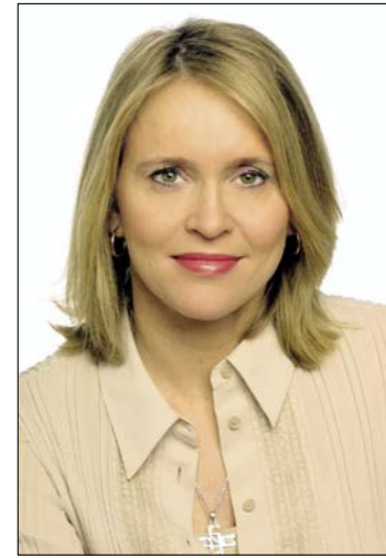
Mrs. Þorgerður Katrín Gunnarsdóttir, Iceland's Minister of Education, Science and Culture

愛知万博のアイスランドデーと私達のホストシティ・知立市でのアイスランド・アート・フェスティバルは、2国間の絆をさらに強めてくれるものと信じています。みなさまに私達の文化的なイベントを存分にお楽しみいただき、また感動していただけることを願っています。