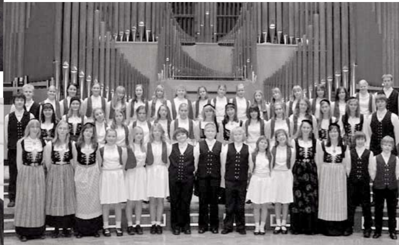
The Kársness School Choir