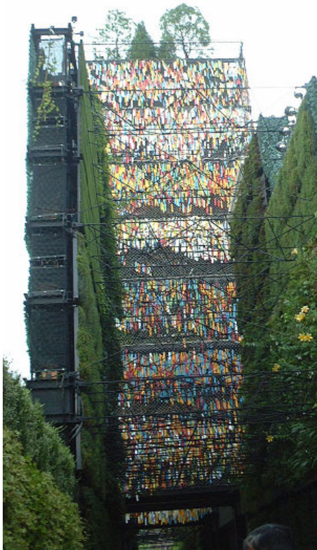
回廊からのタワー側面