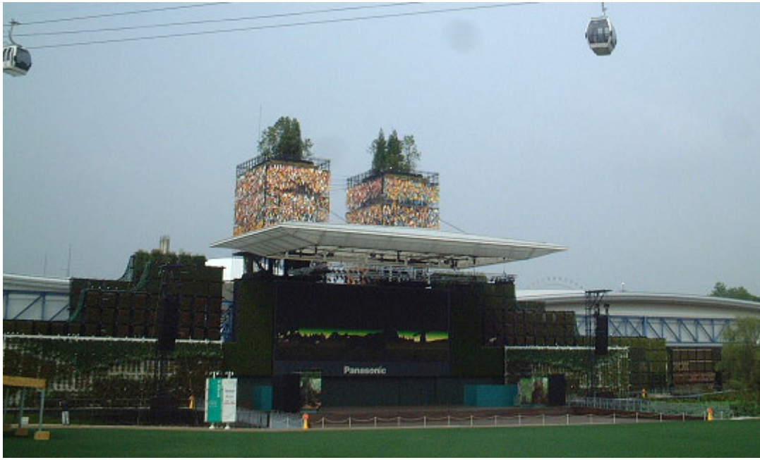
愛・地球広場からの全景