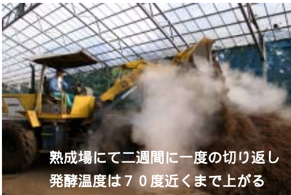
熟成場にて二週間に一度の切り返し 発酵温度は70度近くまで上がる