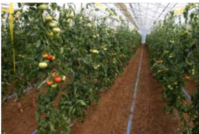
バイオマス発電残渣から出来た 堆肥をトマト畑に散布