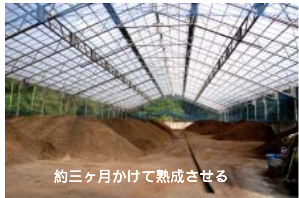
約三ヶ月かけて熟成させる