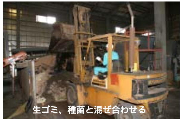
生ゴミ、種菌と混ぜ合わせる