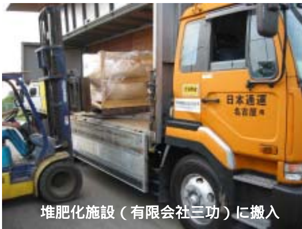
堆肥化施設（有限会社三功）に搬入