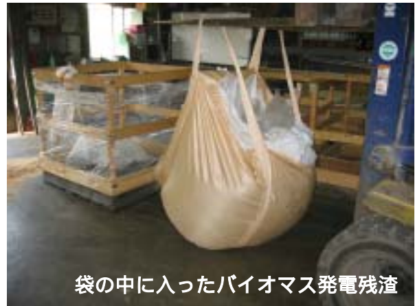
袋の中に入ったバイオマス発電残渣