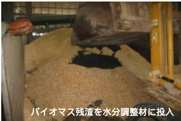
バイオマス残渣を水分調整材に投入