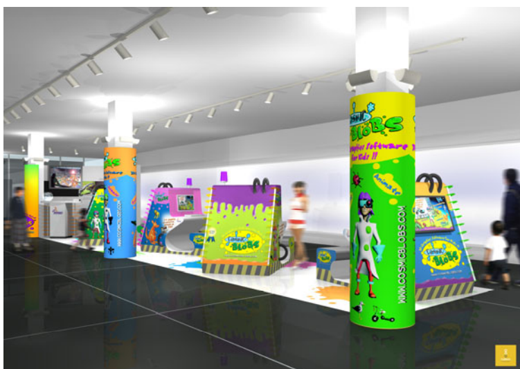
イベント会場イメージ