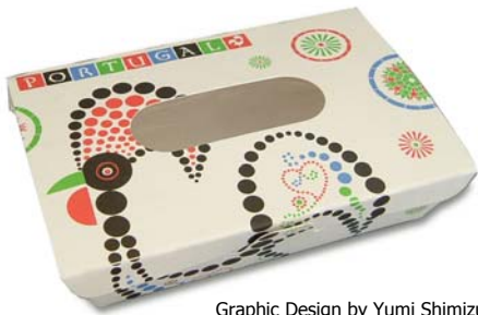
Graphic Design by Yumi Shimizu

紙は、100%バージンパルプを採用しました。古紙由来の有害金属、蛍光材などを一切含みません。使用したフィルム、接着剤も食品衛生法・食品、添加物の規格基準、容器包装の規格基準に適合しています。また、フィルムは抗菌性も持っています。