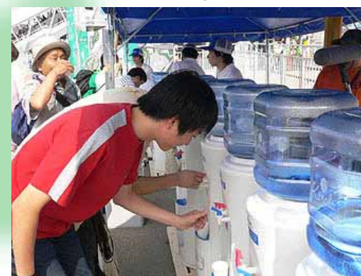
Service de distribution gratuite d'eau fraîche

6/18 Nouveau record des entrées en une seule journée : plus de 170.000 visiteurs Le record précédent du nombre total de visiteurs est largement dépassé.