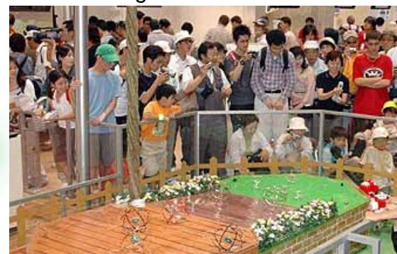
Visiteurs regardant les robots

6/11 Célébration des Noces de Perle à l'Expo Vingt-six couples célèbrent leurs Noces de Perle