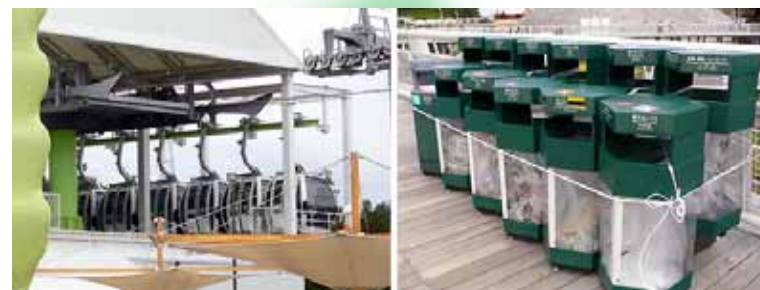
(gauche) Les Gondoles de Kiccoro à l'arrêt. (droite) Les poubelles sont attachées pour ne pas être emportées par le vent.

8/25 L'approche du typhon n°11 nécessite des mesures de précaution et certaines manifestations sont annulées en raison de la pluie en soirée.