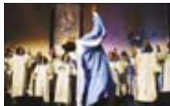
预定进行表演的团体之一The Born Again Choir

佛教音乐、基督教音乐以及回教音乐等,以祈祷为题材的音乐汇聚一堂,共襄盛举。来自全世界的「祈祷之乐」将把观众带入感动的世界。