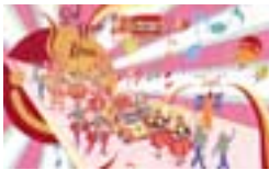
一边演奏充满动感旋律的音乐,一边行进的「Sol ban ban」。

一边进行特技表演或者乐器演奏,一边在全球环路上行进的「Sol ban ban」。还有来自海外的特技表演者在全球共同展区中展现世界一流的特技表演。