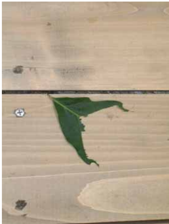
鼯鼠吃的山毛榉树的叶子（鼯鼠吃剩的东西）