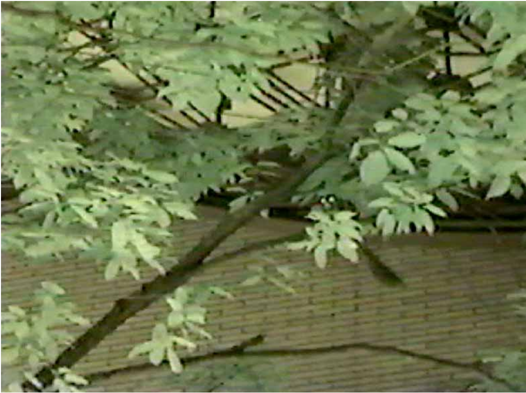
鼯鼠在“山毛榉树”上活动（录像片摘录）